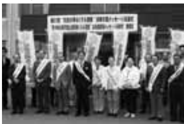
保護司会をはじめとする参席者の皆さん

この運動は、決して難しいものではありません。皆さんは、「相手の気持ちを理解すること」や「子どもをぎゅっと抱きしめること」、「どんだんあいさつすること」など、明るい社会づくりのために、身近なところから協力してみてください。