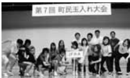
激戦の末、一般の部を制した「JF Aチーム」

6月22日、総合体育館において第7回町民玉入れ大会が開催され、小学生から大人までの32チームの選手205人が熱戦を繰り広げました。1チーム、6人の選手が50個の玉を籠に入れるまでの時間を競うタイムトライアルで、最後のアンカーボールがなかなか入らず周囲からは、盛んに声援が送られていました。