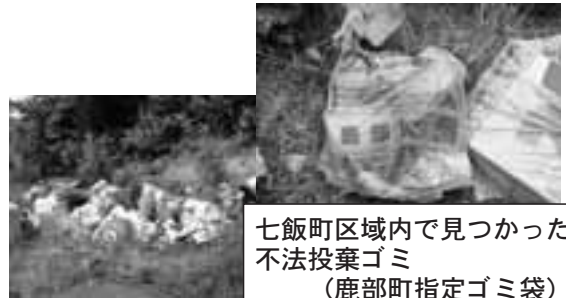
七飯町区域内で見つかった不法投棄ゴミ (鹿部町指定ゴミ袋)