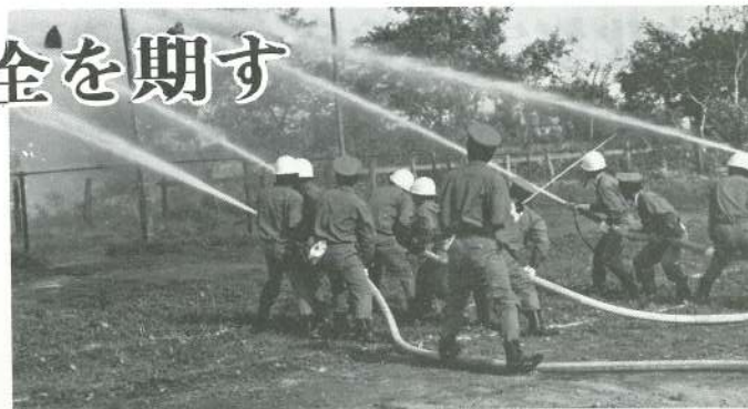
48年秋季消防演習（玉落し競技）