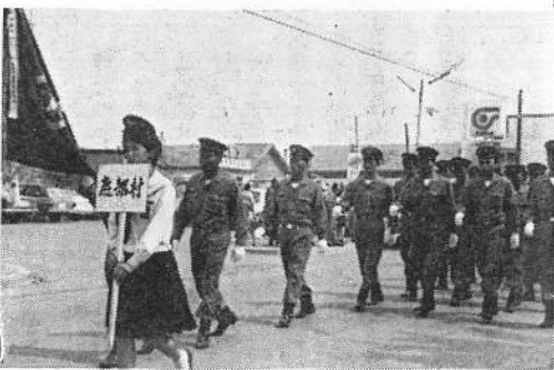
四十四年知内町での渡島大会出場の鹿部村消防団