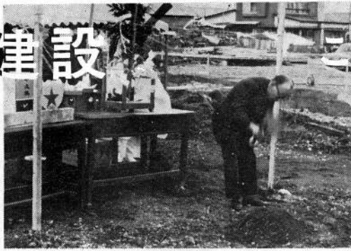
(写真 鍬入れをする棟方村長)