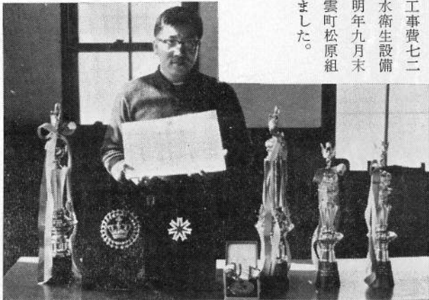
(写真下 かずかずの表状、トロフイ一をもらいました)

全国で総合第二位 種別でも一位・二位獲得 《ミンク共進会》 このたび札幌市において開催された全国ミンク共進会で本村のミンクは優秀であることを認められ、総合で全国第二位に選ばれました。種別でも、バイオレット種の一部で一位・二位・四位（三頭出品全頭が入賞）、サファイア種でも二位と五位（六頭出品）をそれぞれ獲得し、それぞれ、北海道知事よりトロフィーやメダル、表状などを贈られました。 この日全国で約三百頭が出品されました。このミンク共進会は品位、体重、毛質、色つやなどをみて入賞がきめられます。