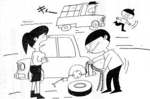
すべり止め装置は完全に

○吹雪、降雪などのため、視界が不十分なときは、とくに車の通行に注意して歩行しましょう。