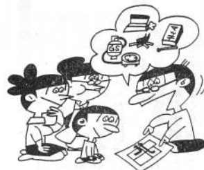
秋の全道火災予防運動（10月15～31日）