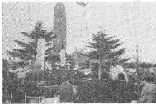
昭和43年度の戦没者慰霊祭が5月24日午前10時より字鹿部稲荷神社忠魂碑前で行なわれました。これは日露戦争以降の戦没者70名の慰霊祭で村内の戦没者叙勲を受けた人たちです。