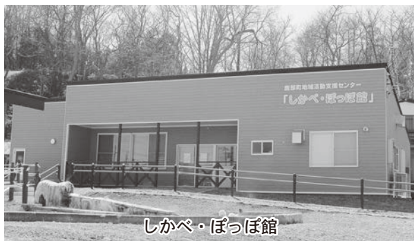
しかべ・ぼっぼ館

◆鹿部町介護保険条例の一部を改正する条例の制定について 内容は、平成27年10月に施行された「行政手続における特定の個人を識別するための番号の利用等に関する法律」に基づき条例の一部を改正するものです。