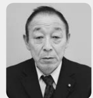
中川一議員 (議員15年以上)