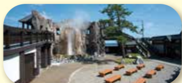
道の駅しかべ間歇泉公園

温泉利用の熱交換式による温水プール。水着で入れる浴室もあります。鹿部町民は無料!