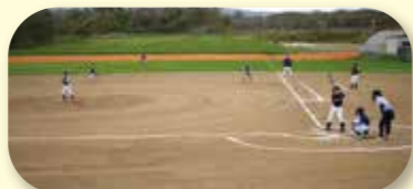
山村広場 多目的グラウンド

アリーナや柔道場、ランニングデッキにトレーニング室、ストレッチルームを備えています。