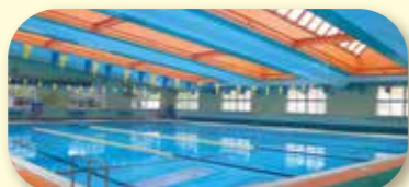
コミュニティー・プール

鹿部町の生涯学習・芸術・地域文化活動の拠点となっている施設です。図書室もあります。