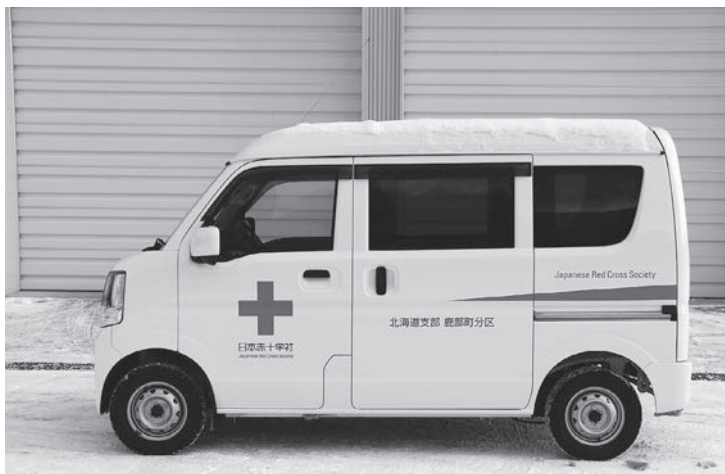
令和5年12月15日に配置された「博愛号」