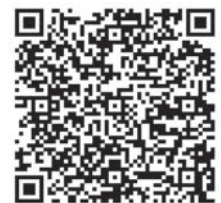
飲酒運転ゼロボックス QRコード