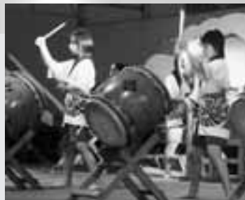
鹿部太鼓・ジュニア太鼓披露