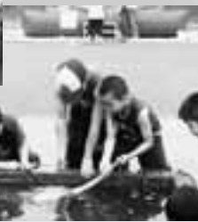
ふれあい水族館 カッター競漕大会