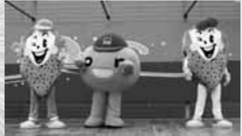
今年は、HTBキャラクターのonちゃん が遊びに来てくれました。