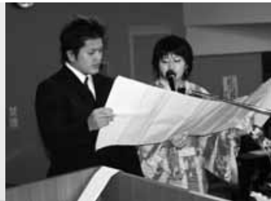
誓いの言葉を読み上げる 家保くんと阿部さん