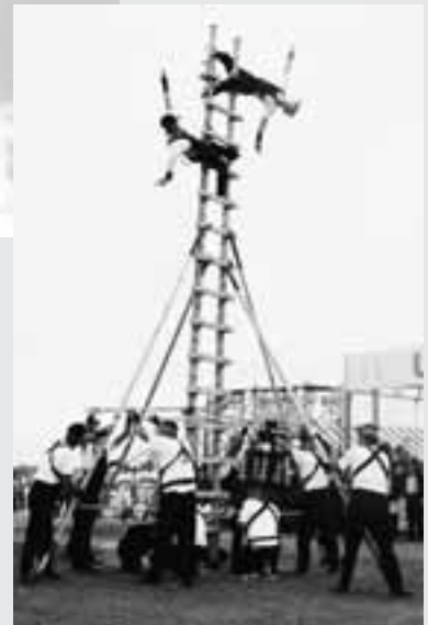
はしご乗り演技披露