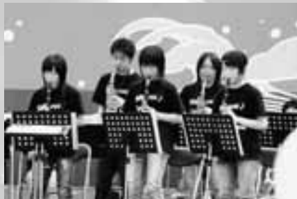
中学校吹奏楽部演奏披露