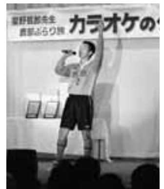
鹿部中学校教諭、元気いっぱいに歌い上げ、会場のお客さんを引きつける！