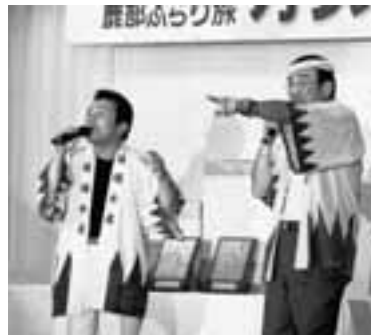
過去の優勝者が、休憩時間に応援歌唱