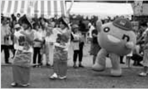
海と温泉のまつり音頭 onちゃんも一緒に！