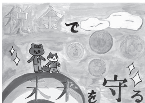
佳作 小野寺さん作