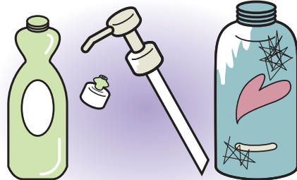
キャップ(ポンプ部分)は外す